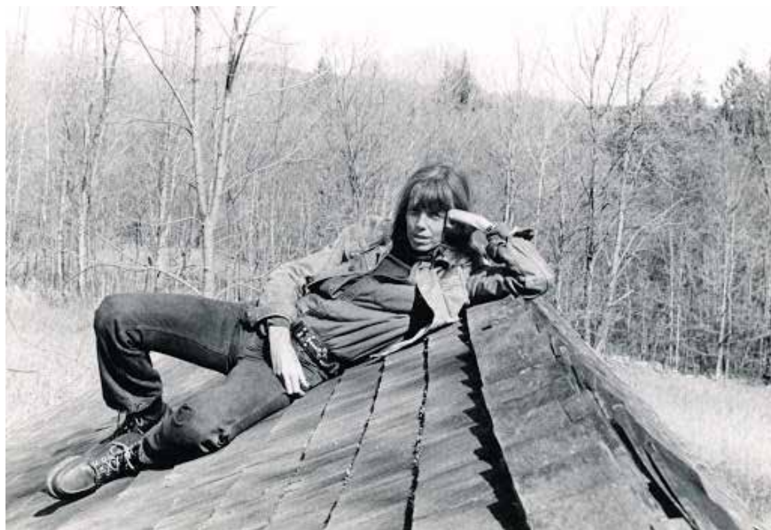
JILL JOHNSTON.